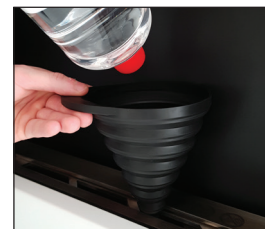
Fyld op med bioethanol vha. en tragt