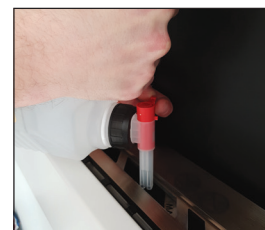
Opfyldning vha. en påfyldningsstud. (Medfølger decoflames 3 liters dunke)