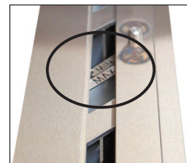
Min. og max indikator